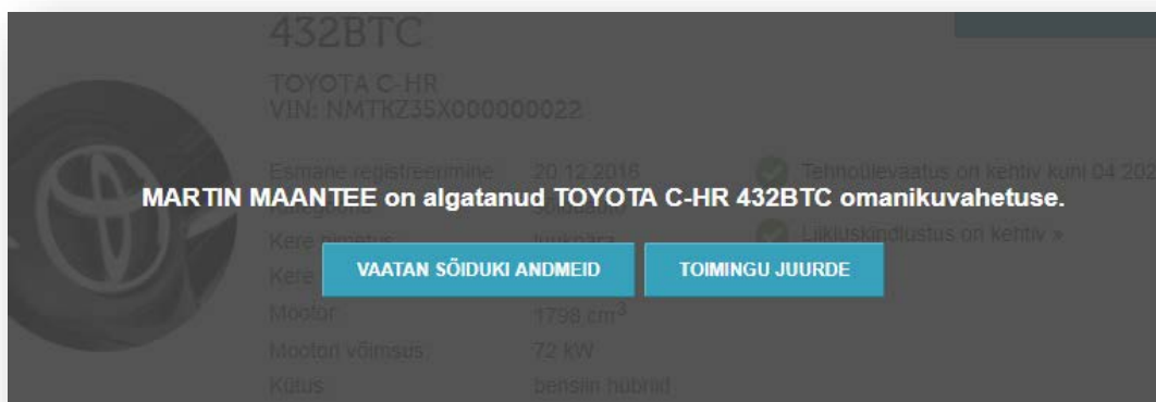
JOONIS 3. VALIK, KAS SOOVID VAADATA SÕIDUKI ANDMEID VÕI ALUSTADA TOIMINGUGA

Avanenud vaatest on võimalik enne allkirjastamist veel minna vaatama sõiduki andmeid, ajalugu ning siis jätkata omanikuvahetust.