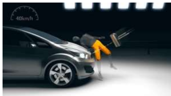
Pilt 2 - Euro NCAP reieosa kokkupõrke mudel

Muutes sõiduki esiosa, näiteks lisades sinna mistahes esikaitstesüsteemi, muutuvad võimalikud jalakäijale tekitavad vigastuste ulatused ja raskusastmed kui ta põrkab kokku sõidukiga. Tüübikinnitamata esikaitstesüsteemi paigaldamisel sõidukile ei ole enam veendunud jalakäija ohutuses ja ei ole teada kuidas toimib esikaitstesüsteem kokkupõrke korral jalakäijaga.