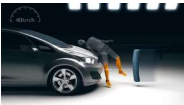
Pilt 1 - Euro NCAP sääreosa kokkupõrke mudel

Tüübikinnituse katsetusest eelaimuse saamiseks on allpool toodud mõned pildid Euro NCAP kokkupõrke katse esitlusmaterjalidest, kus mõneti sarnaselt hinnatakse sääre- ja reieosa kokkupõrke tulemusi.