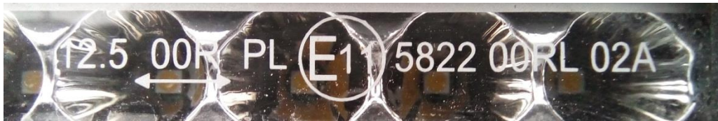
Foto 2: Fotol 1 kujutatud tulelaterna hajutiklaasil asuvad tüübikinnitusmärgid