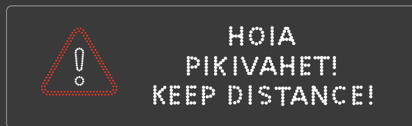
Valik muutuva teabega märke. Selection of variable message signs.